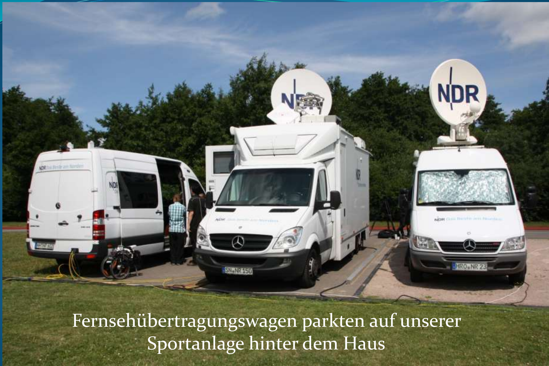
Fernsehübertragungswagen parkten auf unserer Sportanlage hinter dem Haus